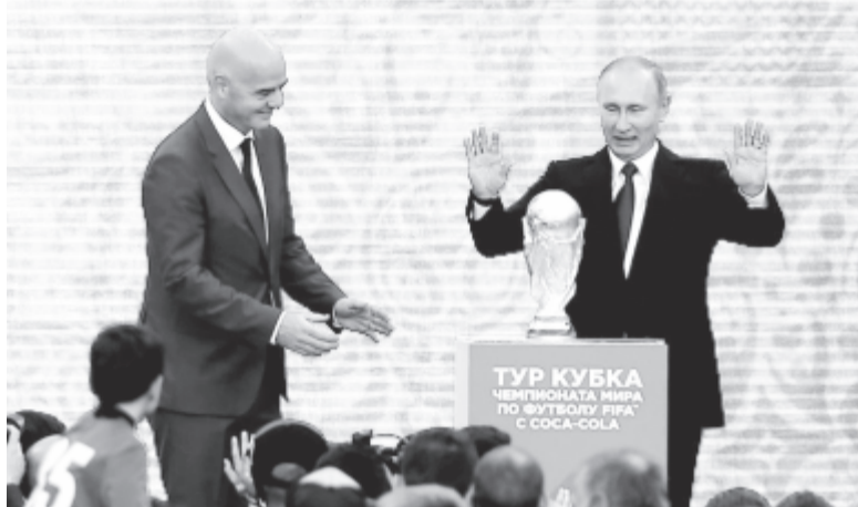
A Nemzetközi Labdarúgó-szövetség (FIFA) elnöke, Gianni Infantino (b) és a vendéglátó ország vezetője, Vlagyimir Putyin a világbajnoki serleggel

Oroszországban ma megkezdődik a labdarúgó-világbajnokság. A nyitómérkőzésen a házigazda orosz