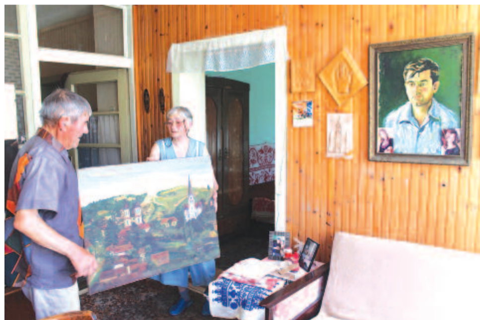
Portré a falon, festmény Nagysármásról