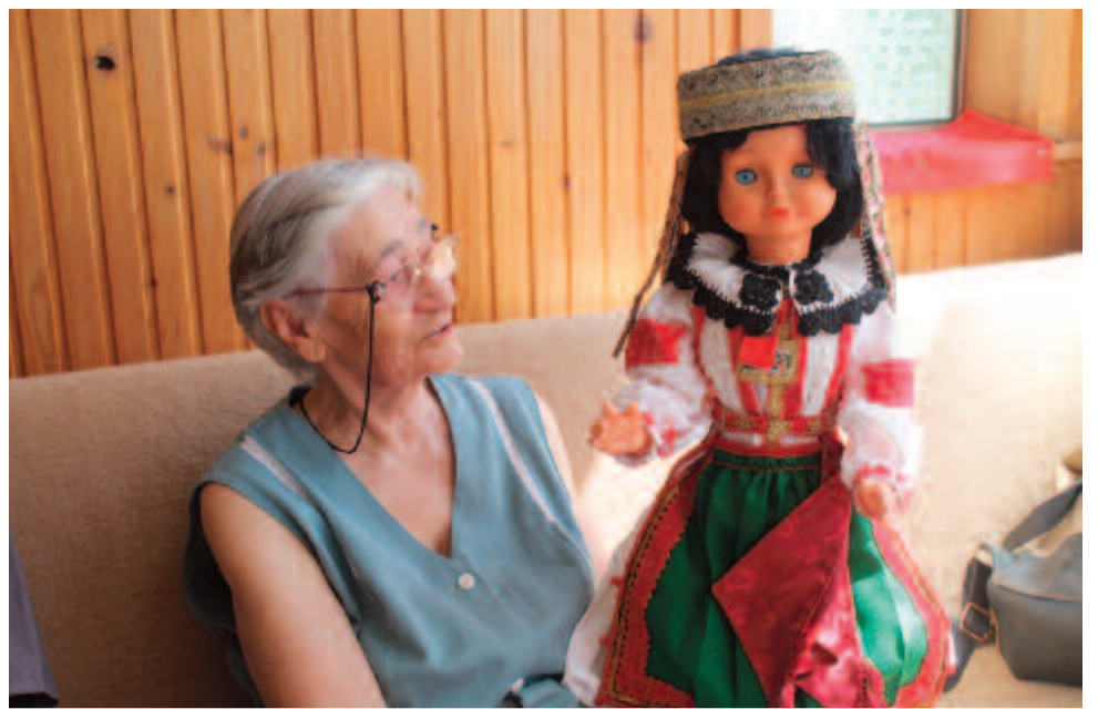
Az óriásbaba torockói viseletben