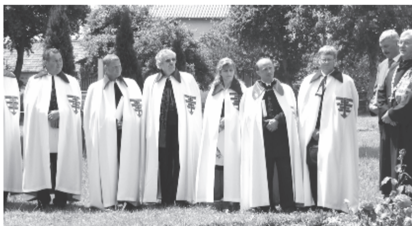
Tavaly hatra bővült az erdélyi lovagok száma, a hét végén ismét hat személyt ütnek lovaggá

niatemplománál, megkoszorúzzák a hősök emlékművét, majd a 11 órától kezdődő szentmise keretében ott is kerül az ünnepélyes lovagavatásra, rangemelésre – tudtuk meg nt. I. Koncz László Ferenc erdélyi székpartótól. (gligor)