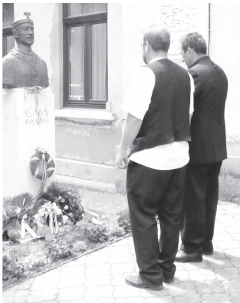
Emlékeztek és koszorúztak Csaba királyfi szobra előtt