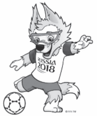
Az A csoport másik két tagja Egyiptom és Uruguay.

A szaúdi gárda nagy erővel készült a vb-re, csak idén kilenc barátságos meccsen lépett pályára. Három siker mellett egy döntetlent ért el, míg ötször vesztesen hagyta el a pályát. Legutóbb a vb-címvédő németek vendégei voltak, s tisztesnek nevezhető 2-1-es vereséget szenvedtek.